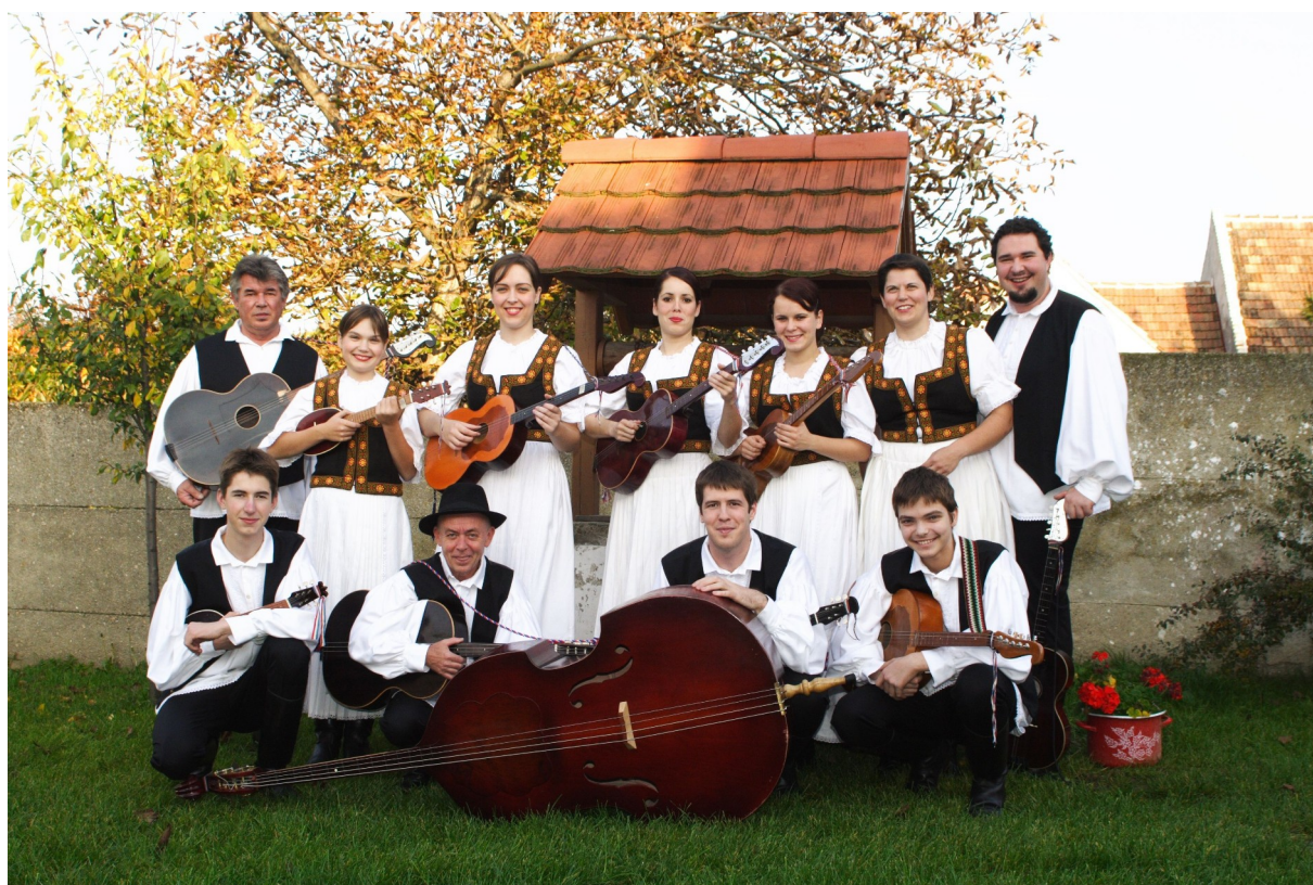
5. Ábra: A Kajkavci tamburaegyüttes 2006-ban

Az együttes 2006-ban megkapta a Magyar Kórusok és Zenekarok Szövetsége által kiadható legmagasabb elismerést a nemzetiségi kategóriában, a KÓTA-díjat.