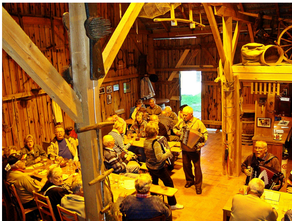
9. Ábra: Rendezvény a Pajtakocsmában

A belső udvar lezárása a pajta, ami kezdetben csak a mezőgazdasági eszközök bemutatását szolgálta. Az elmúlt években azonban új funkciót is kapott; belső terében kialakították a pajtakocsmát. A pajta remek rendezvényhelyszínnek bizonyult, egyre több programot szerveznek ide a helyiek: zenés estek, közös sportrendezvények nézése, családi rendezvények.