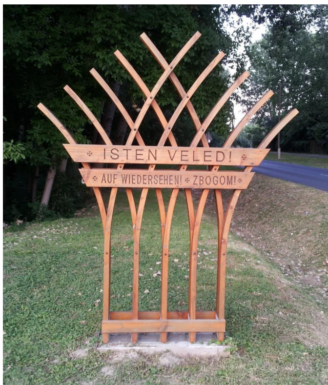
3. Ábra: Üdvözlő tábla a falu szélén