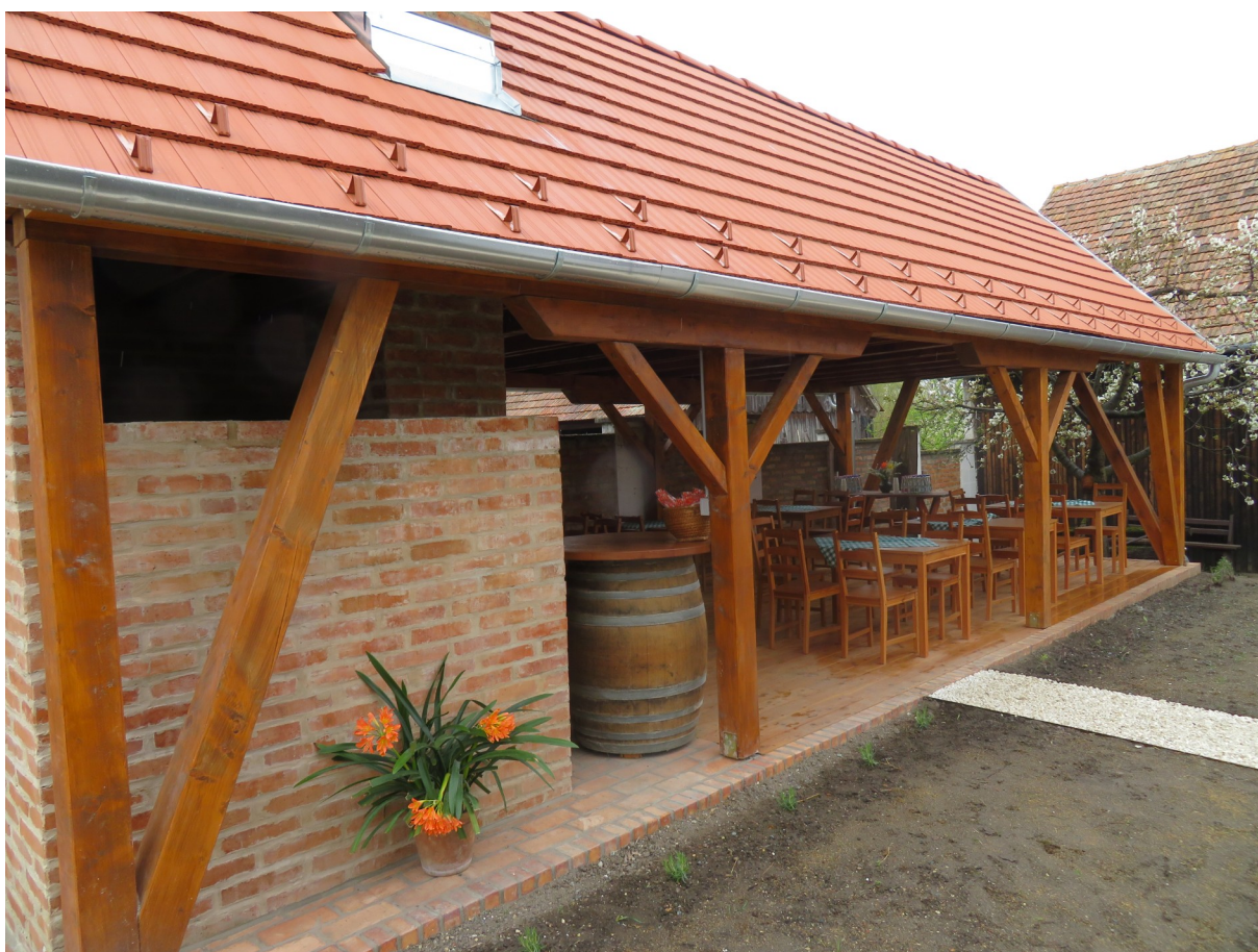
10. Ábra: Foglalkoztató a tájház udvarán

A „Fertő-táj ékkövei” című projekt keretében a fertőhomoki tájházban is több jelentős fejlesztés történt. Megújult a helytörténeti kiállítás, immáron interaktív információs felület várja a látogatókat, ahol archív felvételek, fotók és hanganyagok segítségével lehet megismerkedni a helyi, horvát nemzetiségi kultúrával. Az udvarban helyet kapott egy fedett, foglalkoztató helyiség, egy kültéri kemence és egy mozgáskorlátozott mosdó. A pajta mögötti kertben kialakítottak egy színpadot, melyhez lépcsőzetes nézőtér vezet. A pályázat célja, hogy – a turisztikai funkcióval való bővítéssel és a fenntartható hasznosítással – tovább bővüljön a tájház kínálata, s önálló attrakciónak válhasson a fertőhomoki tájház.