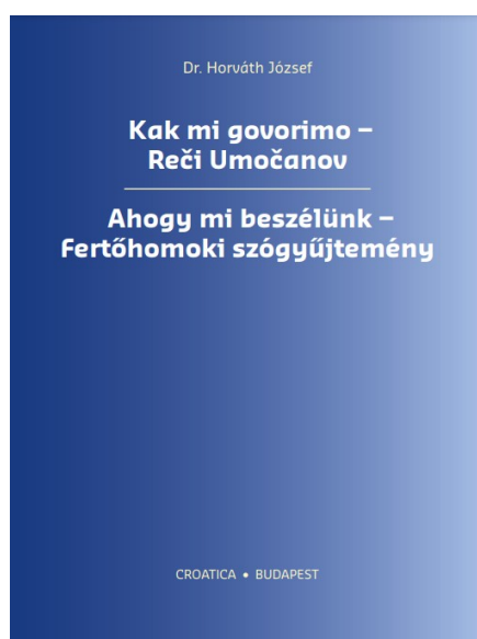
4. Ábra: A fertőhomoki szógyűjtemény borítója