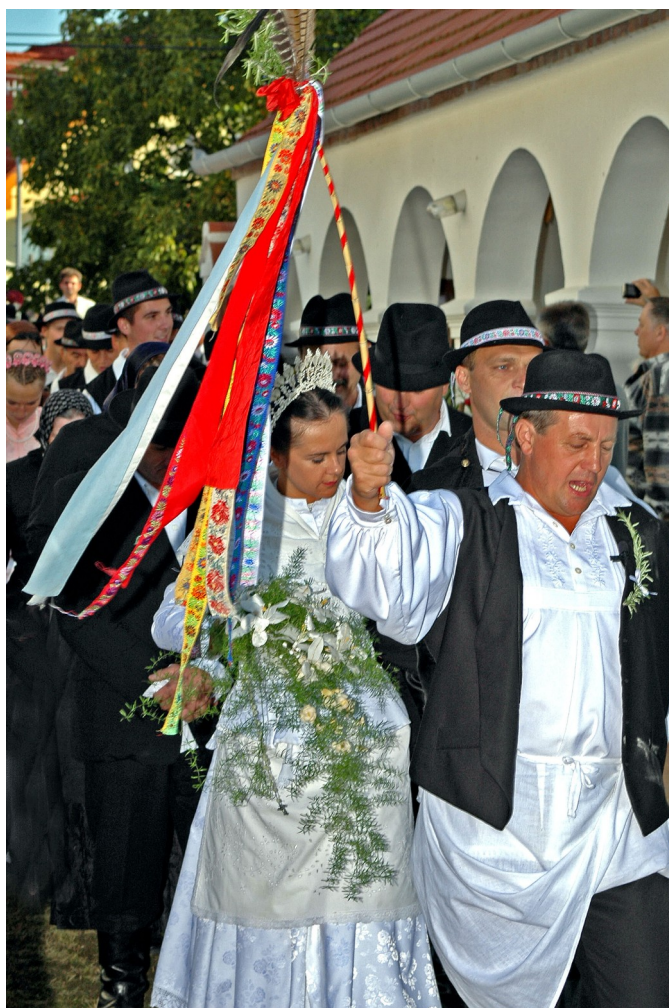
7. Ábra: Homoki lakodalmas - a vabec vezette a násznépet

Vasárnap a közös gyülekezőt követően a vőlegény rokonsága elindult a lányos házhoz, hogy a vabec (vőfély) közreműködésével megtörténjen a kikérés. A lányt a bérmaeresztanya, az úgynevezett kumasszony adta ki. A pár következő útja a templomhoz vezetett, ahol az egyházi esküvőt tartották meg. A polgári szertartás már a lakodalmas sátorban volt, ahová már lakodalmas kocsi vitte az ifjú párt és a zenészeket. A lakodalmas menet dalolva követte a kocsit a falun keresztül. A 400 fős rendezvénysátorban a táncosok és zenészek előadták a lakodalmas koreográfiájukat. A műsor végeztével a plébános áldást mondott, majd elkezdődött a lakoma. A vabec és a zenekar gondoskodott a jó hangulatról. A szokásokhoz kapcsolódó seprútánc, vánkostánc és menyasszonytáncra is sor került a hajnalig tartó mulatságon.