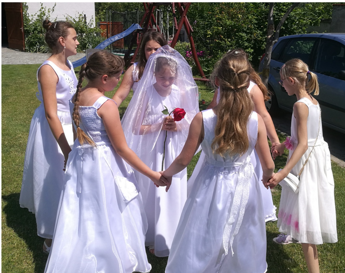
6. Ábra: Pünkösdsölők

„A pünkösdsnek jeles napja...”, illetve a „Máma van, máma van piros pünkösds napja” című dalokat éneklük. Körbe állnak és kezet fogva kettőt balra, kettőt jobbra lépve táncolnak. Ezután a háziasszony felemeli a királyné fátylát. Ha a királyné egy kicsit is elmosolyintja magát, akkor a háziasszony azt mondja „nyüves”. A háziasszony (újabbán) pénzzel szokta jutalmazni a szereplőket, akik az adományokat a végén elosztják egymás között.