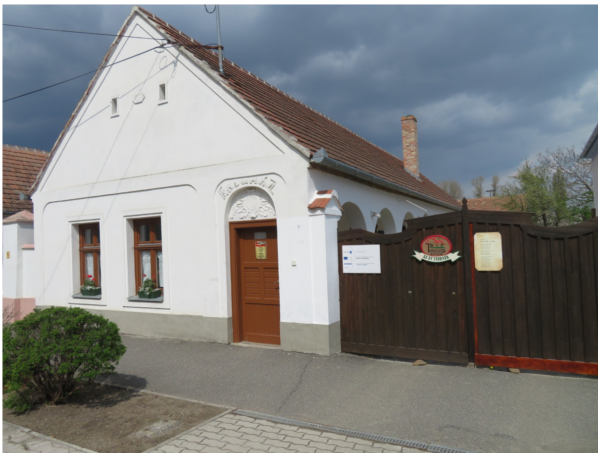
8. Ábra: A fertőhomoki tájház

A település életének egyik legmeghatározóbb helyszíne a falu tájháza. Az eredeti épület az 1930-as tűzvészt követően épült. A 90-es évek végén azzal a céllal vásárolta meg a helyi önkormányzat, hogy segítsen megőrizni és bemutatni e sajátos kultúrájú település múltjából még megmaradt tárgyi emlékeket, hagyományokat és rendezvényhelyszíneként pedig a faluközösség összetartozását erősítse. A teljesen felújított és kibővített portát 2001-ben adták át. 2004-ben a Magyar Tájházak Szövetsége „Az év tájháza” címmel jutalmazta.